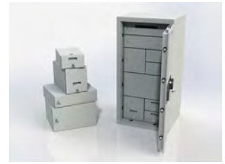
Accesorios Serie 7xx