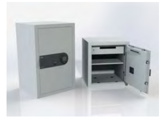
Serie 740 750