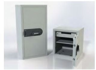
Serie 760 770