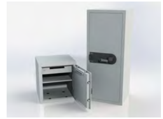
Serie 780 790